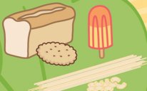
Spesialprodukter med lite protein