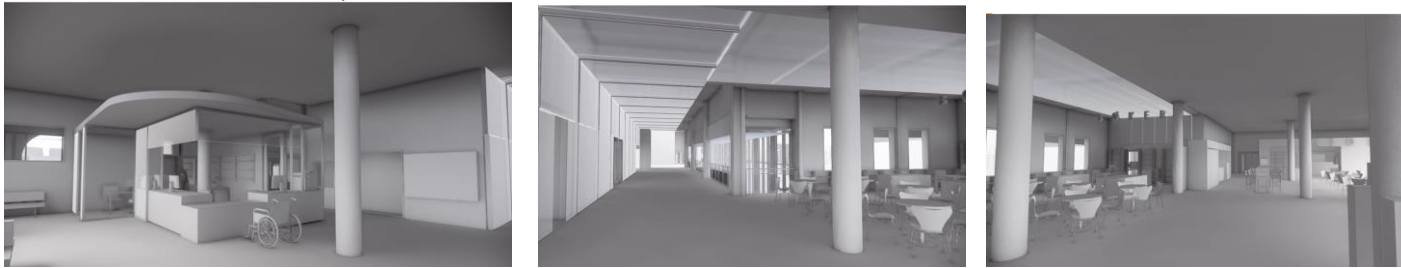
Bilde 1 - Fase 1 Prøvetaking og midlertidig hovedinngang, bygg B2 plan 01