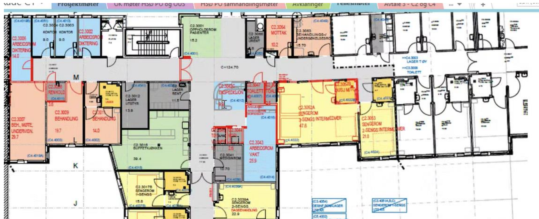
Bilde 1 – bygg C2, plan 02 sengepost NVR, underlag fra forprosjektet